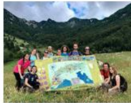
Prealpi Giulie Jugendrat (consiglio dei giovani)