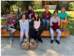
EuroMAB Youth Forum 2022