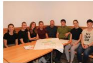
Jugendforum Nockberge 2022

https://www.euro-mab.org/en/activities/youth-forum-2022